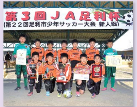
▲優勝した御厨FCの皆さん