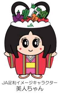
JA足利イメージキャラクター 美人ちゃん

JA足利では「食と農を基軸として地域に根ざした協同組合」をめざし、地域農業のさらなる発展とより豊かで暮らしやすい地域社会の実現に向けた取り組み「自己改革」を進めています。「自己改革」では次の3つの目標を掲げ、より地域社会に貢献するJAとなるべく改革を行っています。