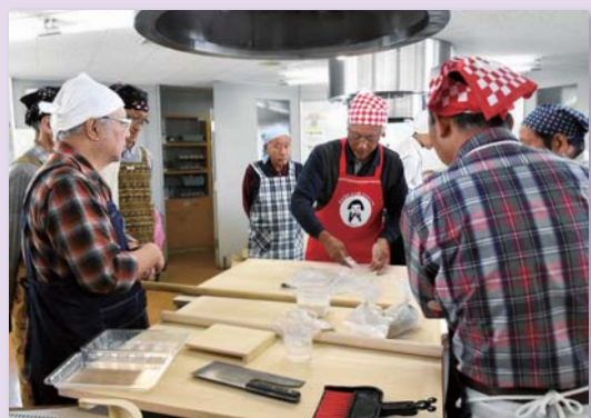
▲講師の説明を真剣に聞く参加者