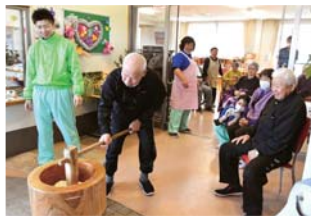
▲よいしょ！ よいしょ！

12月27日はもちつきを行い、利用 者のみなさんはつきたてのもちを味わ いました。