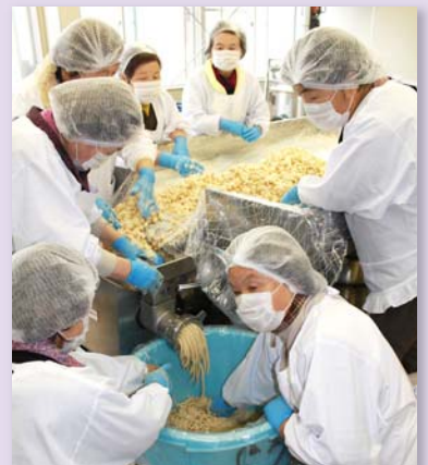
◀みそ造りを行うみどり会会員