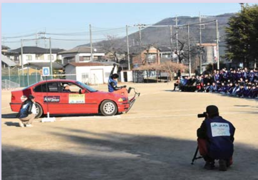
▲スタントマンによる事故の再現

講習ではスタントマンが実際に事故を再現し、生徒に事故の恐ろしさと呼び掛けました。