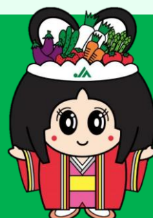
JA足利イメージキャラクター「美人ちゃん」